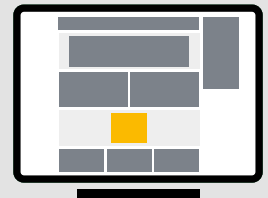
Rectangle Desktop 300 x 250 px (Dateigrösse: max. 250 KB)