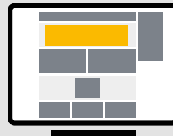
Wideboard Desktop 994 x 250 px (Dateigrösse: max. 500 KB)