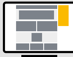
Halfpage nur Desktop 300 x 600 px (Dateigrösse: max. 500 KB)

Banner bleibt beim Scrollen auf dem Bildschirm stehen. (Fachsprache: «sticky»).